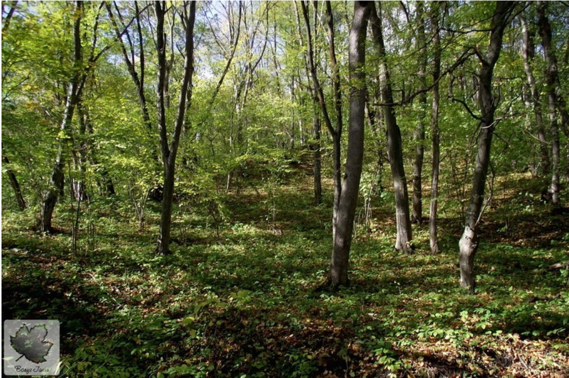
Загальний вид на площу городища Говда із жертвної ями.

В 12 столітті криницю засипали. Опісля над нею в овалі поглибленні розпалювався вогонь і в насипі валу була зроблена ниткоподібна хлібна піч. У верхньому шарі знайдено кераміку 12 - першої половини 13 століть, уламок скляного браслета, кілька наконечників стріл, кресало, шиферне прясельце, кістки тварин. Таким чином, на місці криниці залишили жертвну яму [5], [6].