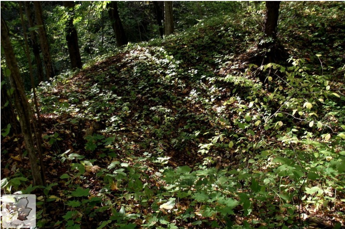
Вид на залишки жертвовної криниці з валу городища.

В 11 столітті в городищі було викопано криницю, яка мала культове значення. Вона перерізає вал у південній частині, мала зверху пологі стінки і конусоподібну форму, а з глибини 60 см - вертикальні стінки, обкладені камінням і укріплені колодами. У плані криниця кругла (діаметр 3,4 м). Розкопана до глибини 3,6 м. Знайдена кераміка 11 століття та кістки тварин. До криниці примикає майданчик, на якому часто горів вогонь, тому є шар вугілля, пов'язаний з прошарками внутрішнього рову [5], [6].