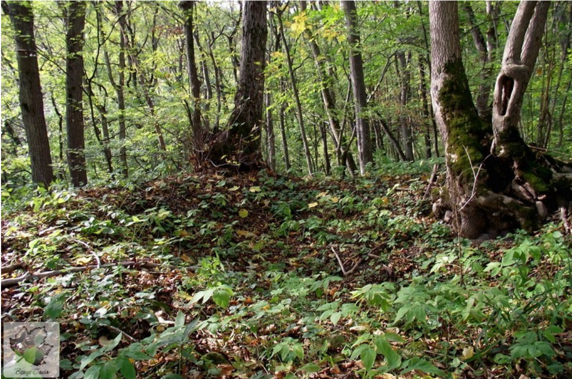
Вид на яму на найвищій точці валу.

В 11 столітті в городищі було викопано криницю, яка мала культове значення. Вона перерізає вал у південній частині, мала зверху пологі стінки і конусоподібну форму, а з глибини 60 см - вертикальні стінки, обкладені камінням і укріплені колодами. У плані криниця кругла (діаметр 3,4 м). Розкопана до глибини 3,6 м. Знайдена кераміка 11 століття та кістки тварин. До криниці примикає майданчик, на якому часто горів вогонь, тому є шар вугілля, пов'язаний з прошарками внутрішнього рову [5], [6].