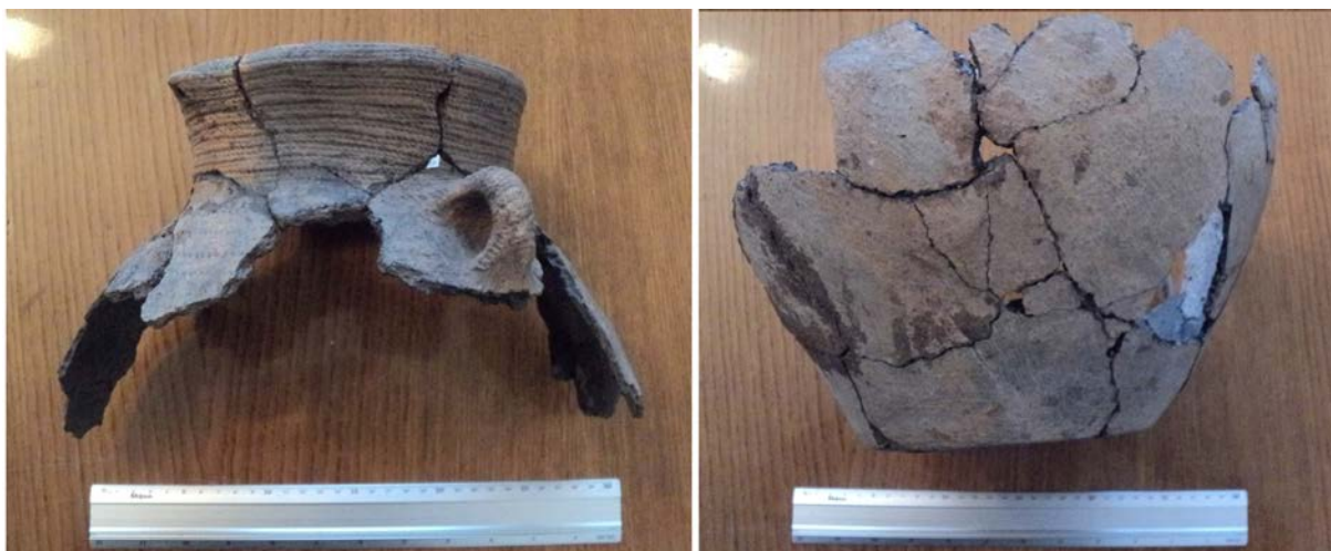
Фото 15.* Белз, урочище Замочок. Амфора стжижовської культури Photo 15. Belz, Zamochock Place. Amphora of Stzhyzhovska culture