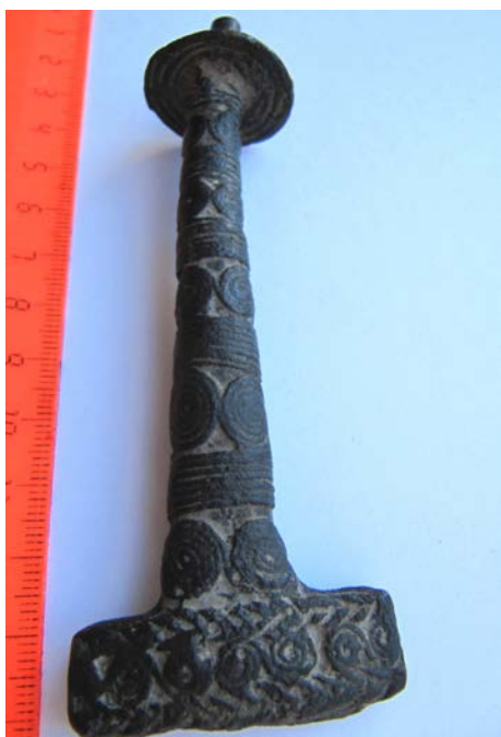
Фото 16.** Бронзовий ефес меча. с. Перевоз Photo 16. Bronze hilt of the sword from Perevoz