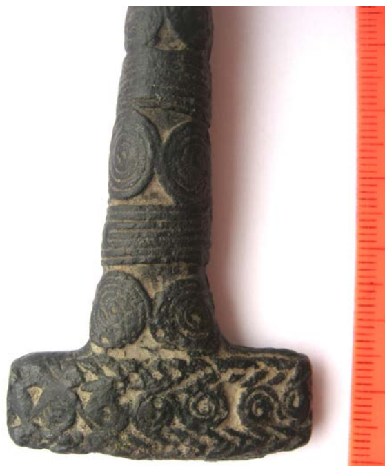
Фото 17. Перехрестя (гарди) з частиною руків'я. с. Перевоз Photo 17 Cross-head (guard) with part of a handle from Perevoz

* Фото 15 до статті М. Войтович Photos 15 to article of M. Vojtovych