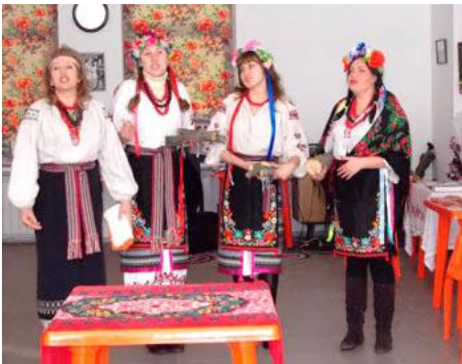
Фольклорно-обрядовий колектив "Оріани" (Запоріжжя) на святі Колодія

Олекса Воропай пише наступне: "Нам відомо, що по християнізації України-Руси місце поганських богів зайняли християнські святі. Згідно з народнім уявленням, вони стали покровителями тих ділянок людського життя, якими опікувались давніше поганські боги. Так громовержця Перуна замінив святий пророк Ілля, а Волоса – святий мученик Влас... В народніх віруваннях святий Влас – покровитель худоби, а особливо корів. В цей день селяни служили по дворах молебні, вносили образ святого мученика в стайню або загороду, де стояв скот, кропили худобу свяченою водою та обкурювали ладаном – "щоб скот добре плодився та не хорів"... Народи скандінавських країн у своїх мітах теж мають вола-бога, що зветься у них «Val-ass» або «Valiass». Див. «Edda Saemundina», t. III." [3, 209, 211].