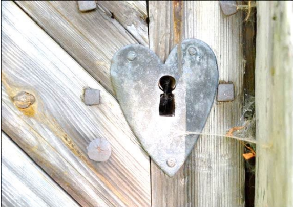
Замкова щілина у вигляді сердечка

На Триглаві (Тризубі) зображена боротьба Перуна і Велеса на середньому зубі: стріла (копіє) б'є у сердечко в нижній частині, або копіє б'є між рогів Велеса, які одночасно можуть символізувати і жіночий двір (лоно).