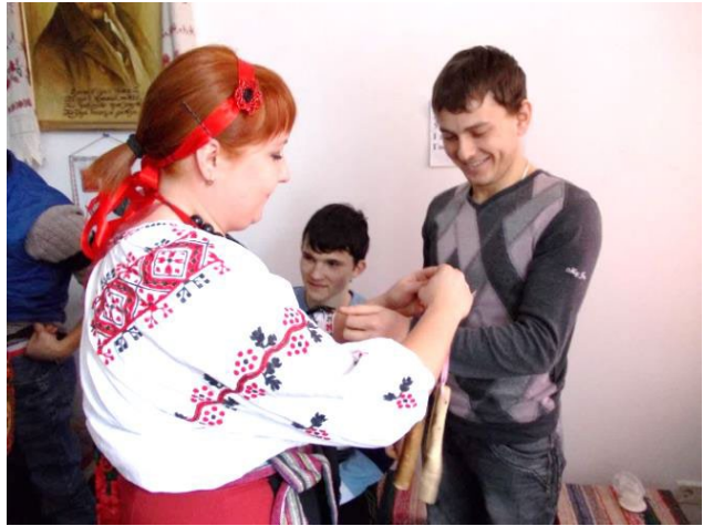
Жінки пов'язують колодку неодруженим

Чіпляли колодку й парубкам, власне в першу чергу, які не женились та дівчатам, насамперед тим, що відмовили тому, чи іншому парубкові. Колодка діяла та галасала по всьому селу з понеділка до суботи, до "похорону колодки". До прийняття жіночого гурту-колодки готувалися всі ті батьки, які мали синів на одружені та доньок на порі. Колодку прив'язували чоловікам до лівої ноги, а хлопцям-парубкам та дівчатам – до лівої руки, а чи до пояса. Чіпляли й дівчата хлопцям