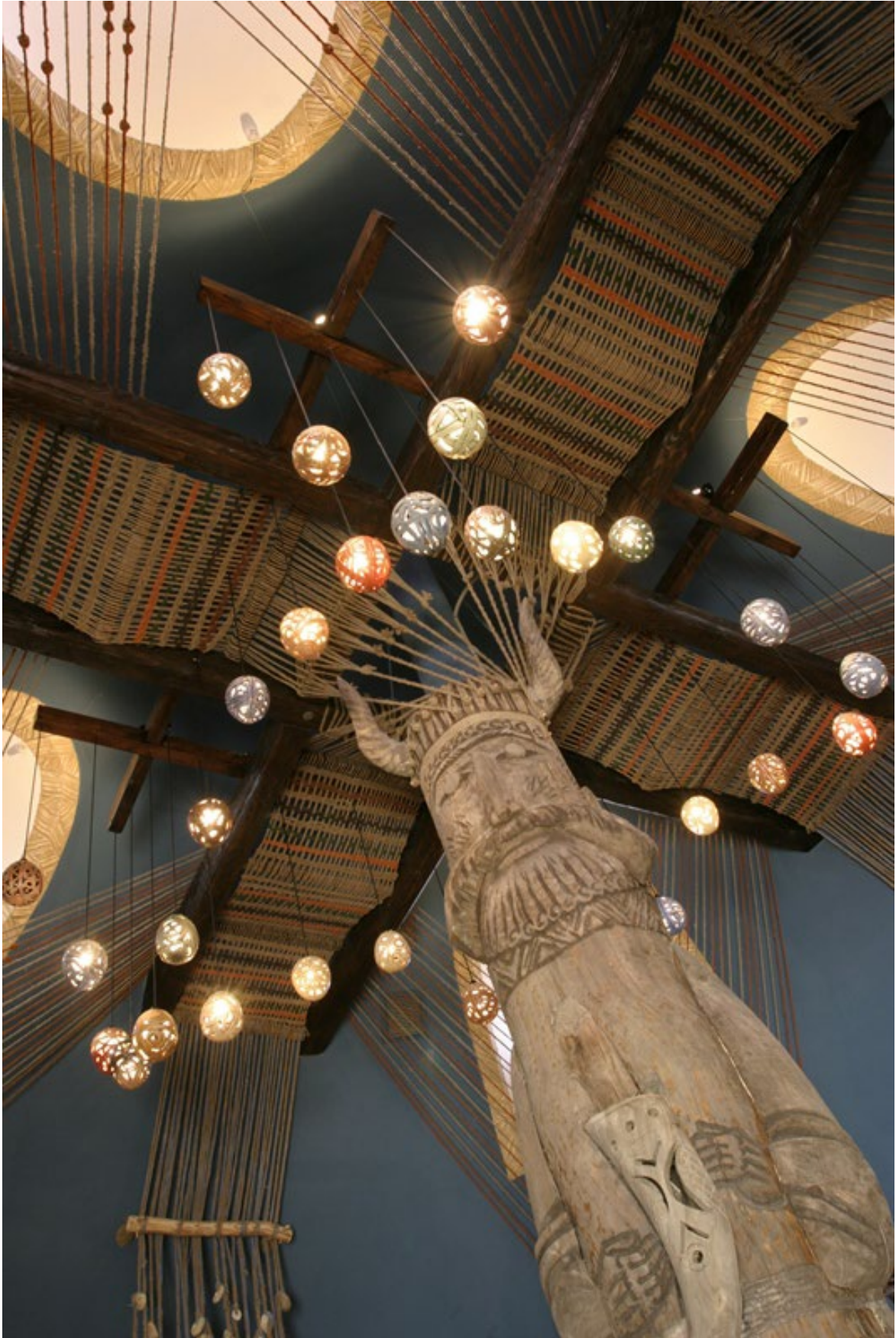
Образ Велеса в ресторане. Золотоноша, Україна.