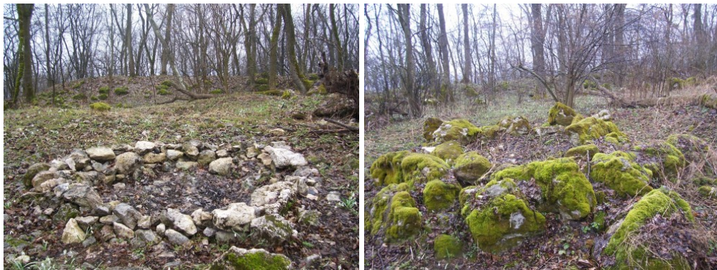
Святилище на Богиті: місце розташування ідола та збережене капище

До так званого Збручанського культового центру входили такі основні вже виявлені городища, храми та цілі комплекси: городище-святилище на горі Богит, де гіпотетично стояв ідол Святовита, городище-святилище Звенигород, городище-святилище Говда, поселення Бабина долина — супутник Звенигорода, а також городища на горі Рожаниця, узгір'ях Баба, Триніг, Старий Кут, горах Високий Камінь, Сабариха та інші.