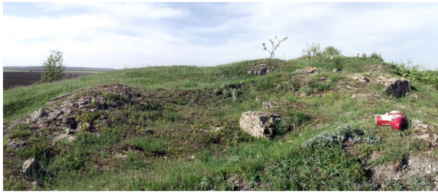
Святилище на Сабарисі